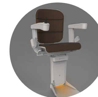
Podnzek z owietleniem (opcja)