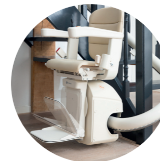
Automatycznie składanie podnzka (opcja)