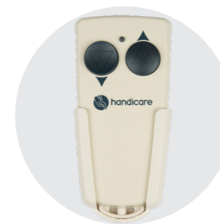
Piloty na przystankach