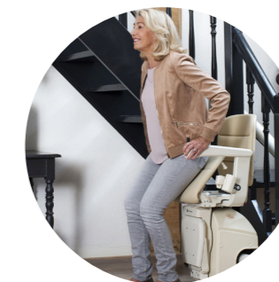
Pomoc przy wstawaniu (opcja)