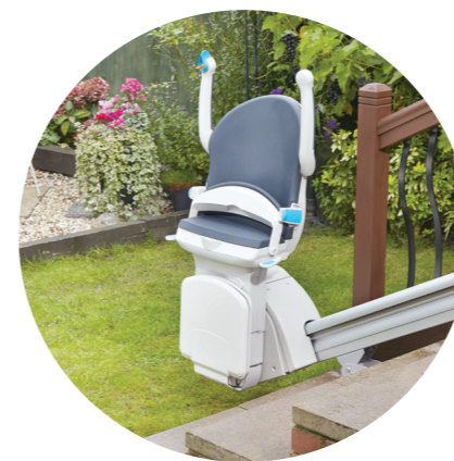
Krzesiwo złożone na przystanku