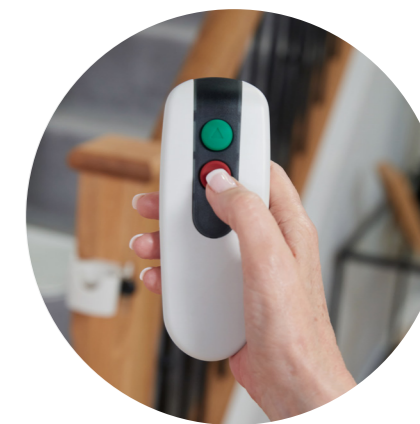
Pilot do sterowania z przystanków