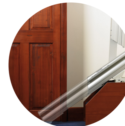
Składana dolna końcówka szyny