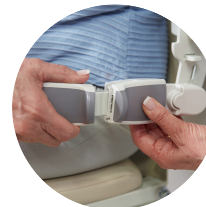
Samonapinający pas bezpieczeństwa