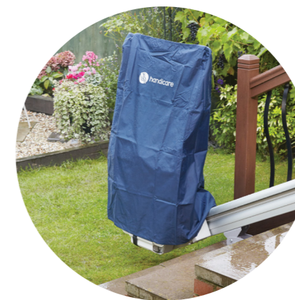
Pokrowiec na krzesiwo